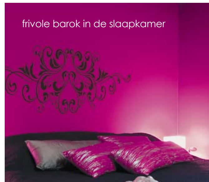
frivole barok in de slaapkamer

Surf naar www.louandfriends.com of ga langs bij jouw colora-winkel.