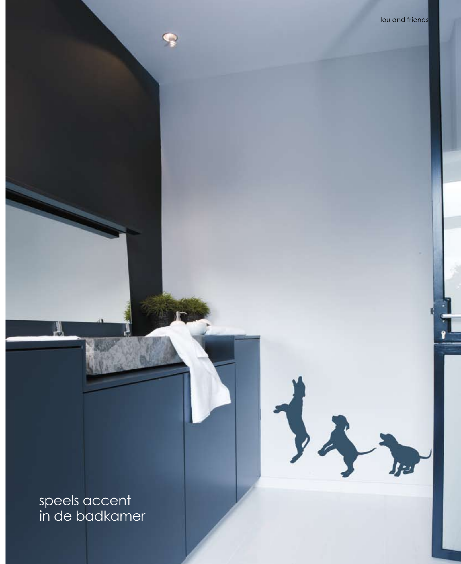
speels accent in de badkamer